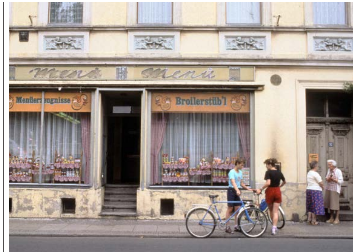
Kurz vor Ladenschließung: Das Feinkostgeschäft in Fürstenwalde mit kleiner Verkaufsfläche und in maroder baulicher Verfassung steht beispielhaft für die Lage des Einzelhandels in der späten DDR.

Dabei wollen die westdeutschen Handelsfirmen anfangs durchaus mit dem DDR-Handel zusammenarbeiten, beispielsweise im Rahmen von Belieferungsvereinbarungen mit ostdeutschen Handelseinrichtungen. So versorgt die Westberliner Firma Reichelt ab Mitte Februar 1990 vier Ostberliner Kaufhallen mit frischem Obst und Gemüse. Abgerechnet werden die jeweiligen Tagespreise zum Kurs von 1 : 3, sodass beispielsweise am 19. Februar eine Kiwi 1,90 Ost-Mark, eine Gurke 8,70 Ost-Mark oder ein Kilogramm Bananen 8,40 Ost-Mark kosten. Trotz der relativ hoch erscheinenden Preise stößt das