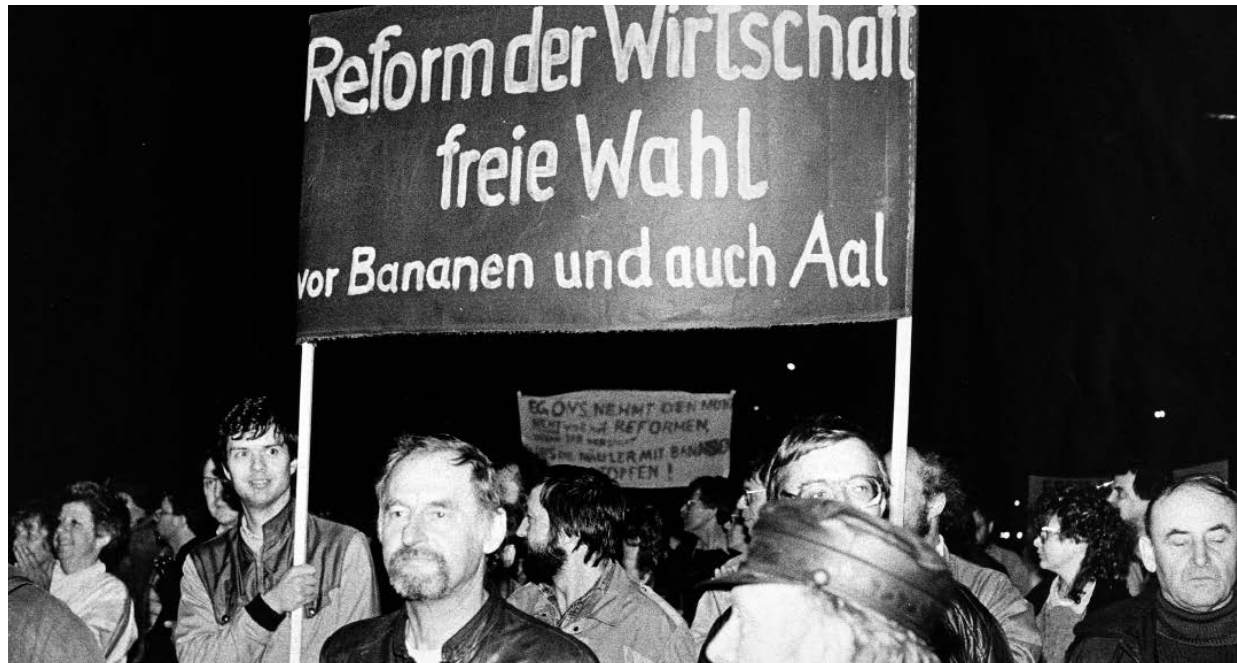
Poesie des Protests: Auch die mangelhafte Warenversorgung in der DDR ist für viele Bürger ein Grund, auf die Straße zu gehen. Doch anstelle rein materialistischer Forderungen nach westlichem Überfluss geht es den Teilnehmern einer Leipziger Montagsdemonstration im Herbst 1989 um grundlegende Reformen in Wirtschaft und Politik.

ren. Bei einer Umfrage des Leipziger Instituts für Marktforschung im Dezember 1989 gaben 91 Prozent der befragten Ostdeutschen an, ein besseres Warenangebot sei ihnen wichtig. Damit verwies der Wunsch nach besseren Konsumangeboten andere Ziele, wie politische Reformen (87 Prozent), freie und geheime Wahlen (85 Prozent) oder freie Reisemöglichkeiten (70 Prozent), auf die Plätze. So überrascht es nicht, dass die DDR-Bürger nach dem Mauerfall die westdeutschen Geschäfte stürmen, um diese und die neue Warenwelt zu erkunden. Dafür stehen ihnen pro Person 100 DM zur Verfügung – das sogenannte Begrüßungsgeld. Mit dieser 1970 eingeführten Zuwendung wollte die Bundesrepublik DDR-Bürgern den Aufenthalt im Westen erleichtern. Gegen Vorlage eines Personalausweises oder Reisepasses kann jeder Besucher aus der DDR das Begrüßungsgeld erhalten.