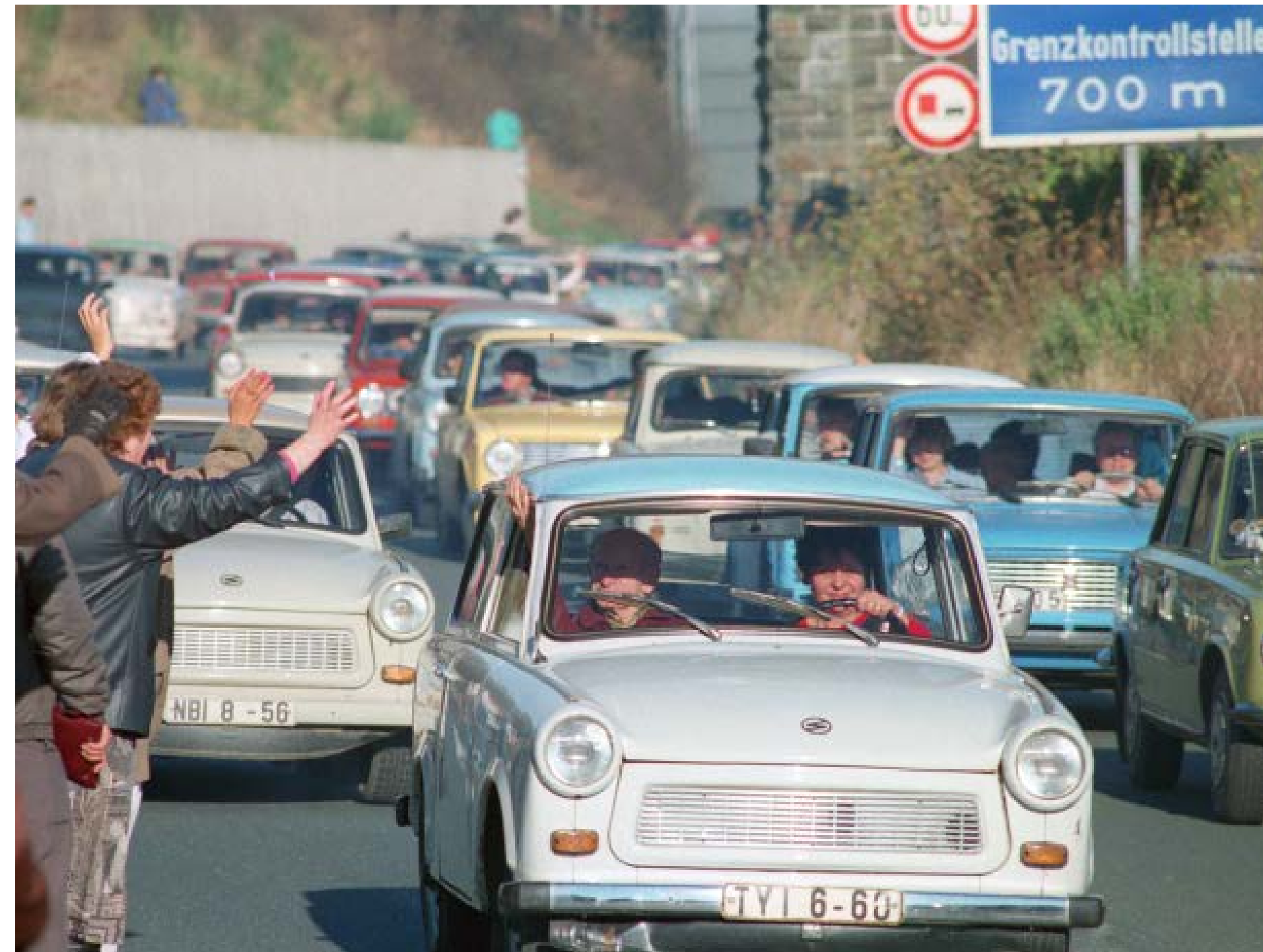
Großer Grenzverkehr: DDR-Bürger überqueren am 10. November 1989 den Grenzübergang Rudolphstein in Richtung Westen.

Insofern verwundert es nicht, wenn Wissenschaftler die friedliche Revolution von 1989 rückblickend auch als „Konsumrevolution“ interpretie- →