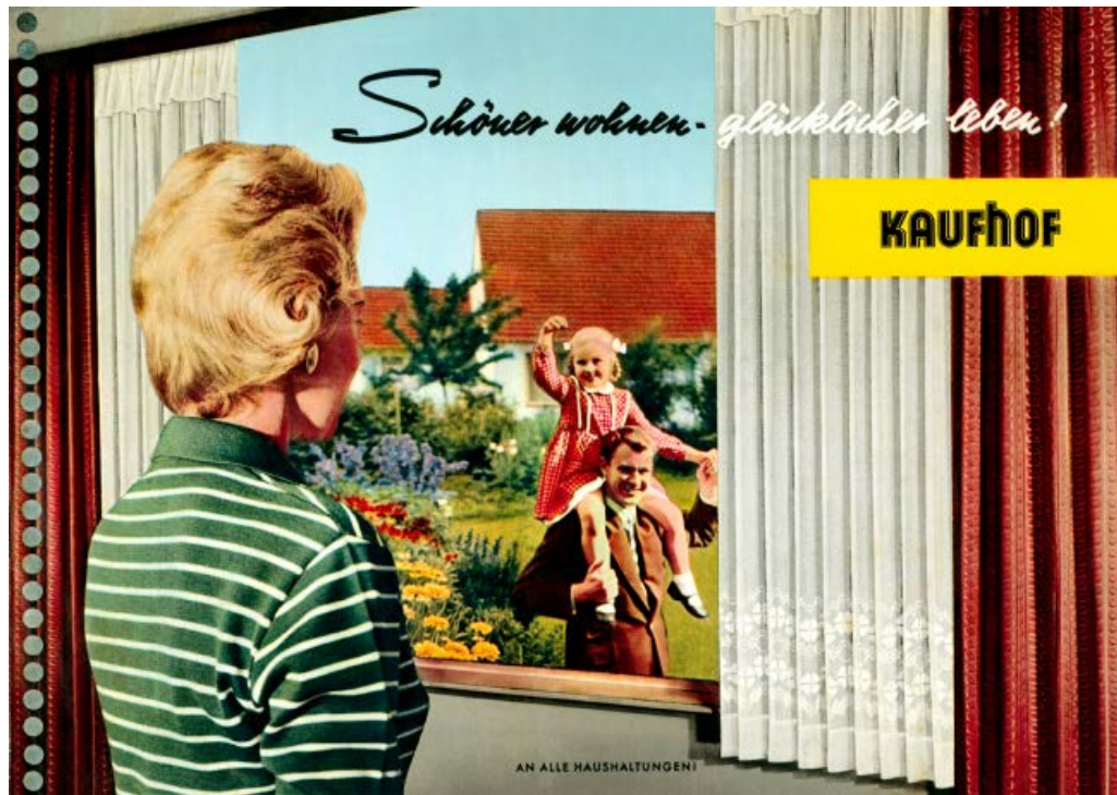
Glück auf Bestellung: Die Referenzgröße für den Alltag im Aufschwung nach der Währungsreform (rechts) ist die Kleinfamilie im Eigenheim. Die Werbung jener Zeit (oben) nimmt vor allem diese Zielgruppe in den Blick.