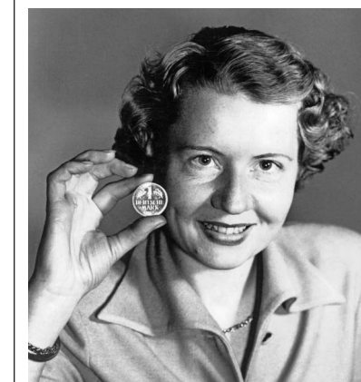
Harte Mark: Die Währungsreform von 1948 markiert den Beginn des rasanten Wirtschaftswachstums, das auch das Selbstverständnis der jungen Bundesrepublik gründet. Der sprichwörtliche "Wohlstand für alle" lässt sich für die breite Bevölkerung vor allem an den Ladentischen des Landes erfahren.

„Supermarkt“ und „Warenhaus“ stehen für die Gewinner und Verlierer des Übergangs vom Nachkriegsboom in die unsicheren Jahrzehnte nach dem Strukturbruch der frühen 1970er-Jahre. Sie →